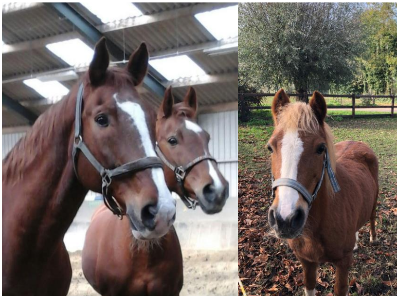
Kandinsky & Promise

Daarop heeft de stichting besloten om de afgekeurde lespony Silhouet (18 jaar) een plekje in de stichting te gunnen.